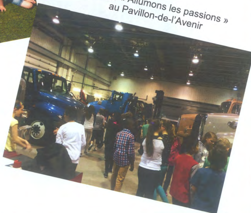
Activité « Allumons les passions » au Pavillon-de-l'Avenir