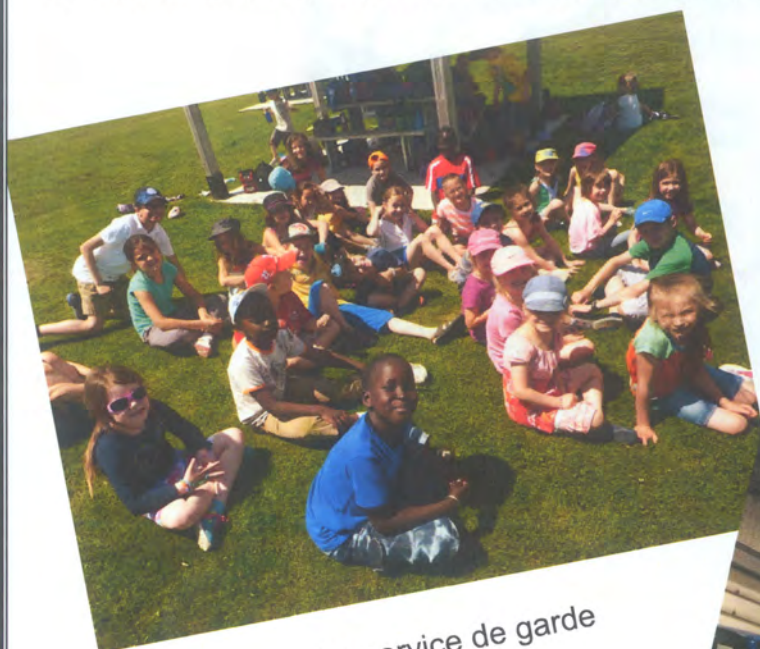
Au service de garde